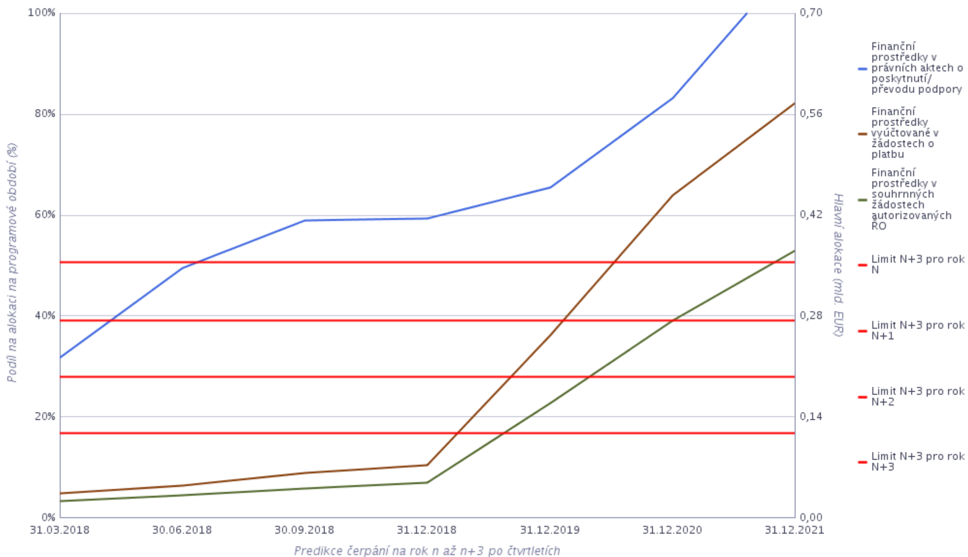
Graf 1 Predikce čerpání pro rok n až n+3 pro EFRR - Více rozvinuté regiony