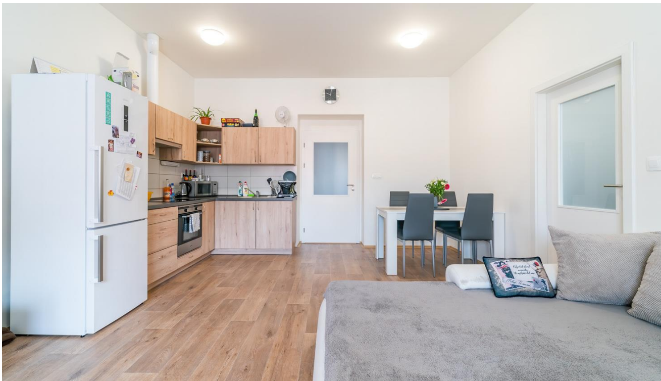
Rekonstrukce domu čp. 319/II Sládkova ulice pro sociální bydlení; Město Jindřichův Hradec