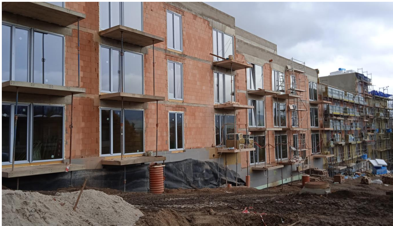
Sociální bydlení města Liberce Na Žižkově dům O