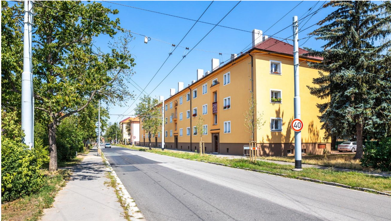
Revitalizace bytového domu Lexova, Pardubice