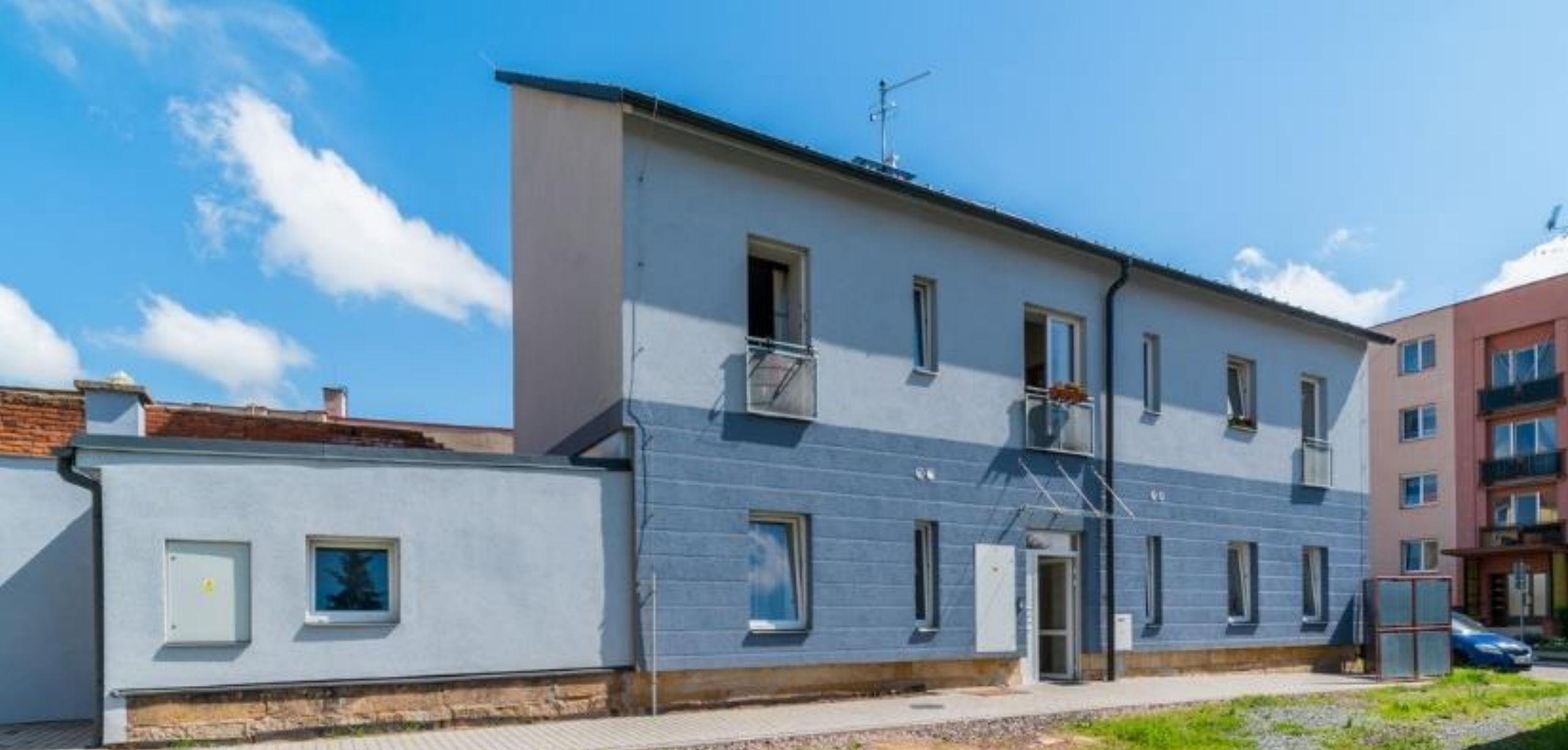
Příklad: Stavební úpravy objektu č.p. 1355, Hořice - čtyři sociální bytové jednotky