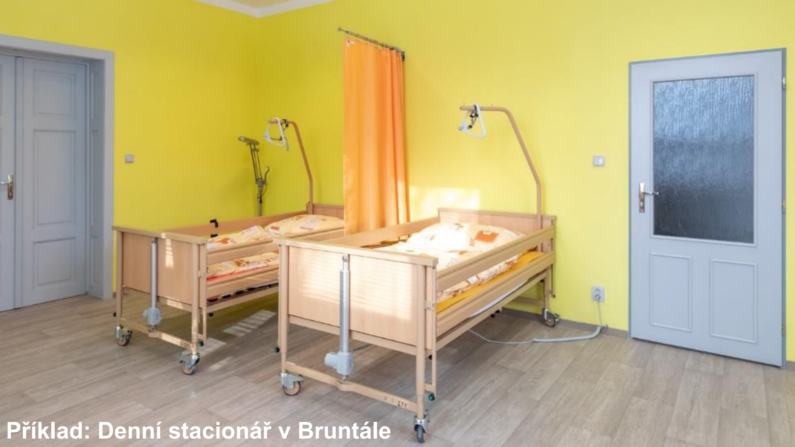
Příklad: Denní stacionář v Bruntále